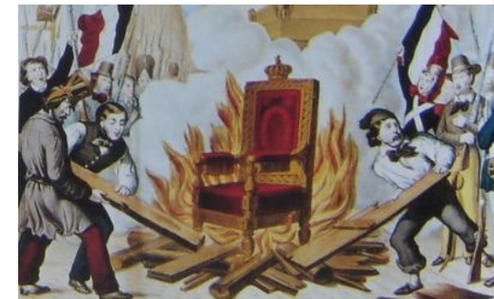
Le trône royal brûlé en 1848