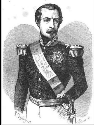
Louis Napoléon Bonaparte.

Président de la République de 1848 à 1852.