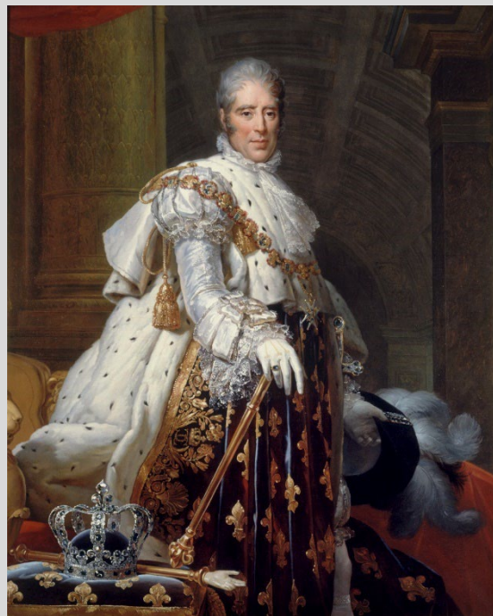
Charles X, Roi de France de 1824 à 1830 Suite à la Révolution des « 3 glorieuses », il abdique en 1830