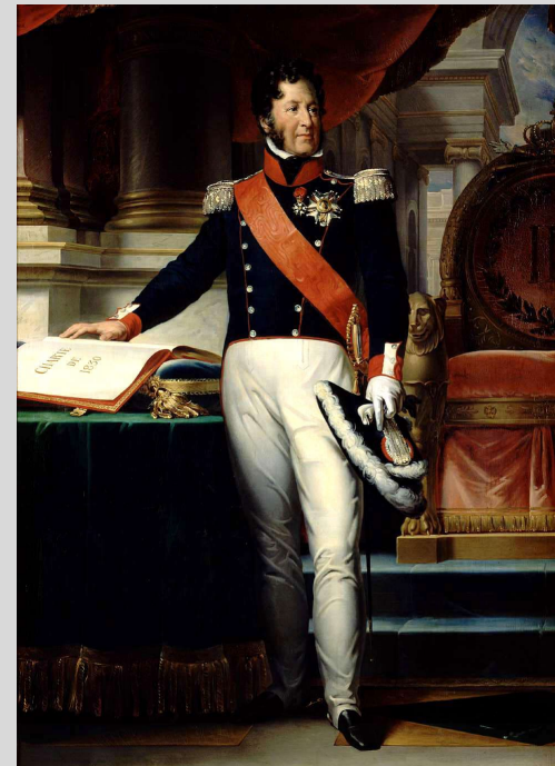
Louis-Philippe 1 er , Roi des Français de 1830 à 1848. Malgré des réformes et l'abandon du style royal, il est renversé par une révolution en 1848.