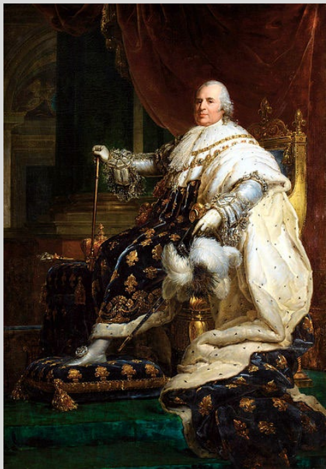
Louis XVIII, Roi de France de 1815 à 1824