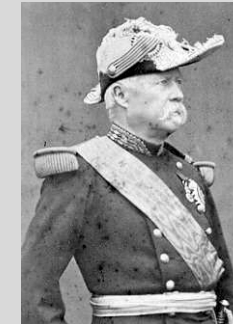
Patrice Mac Mahon